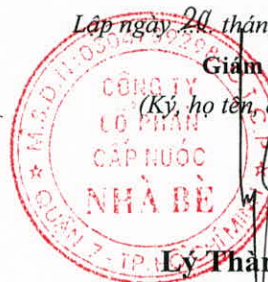
Lý Thành Tài