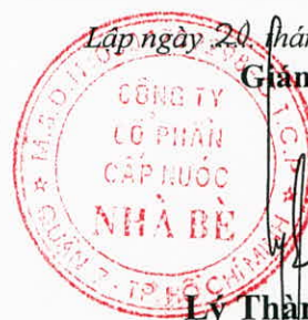
Lý Thành Tài