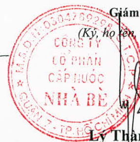
Lý Thành Tài