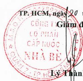
Lý Thành Tài